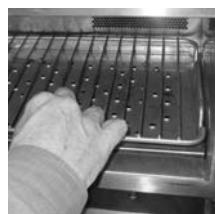
Étape 2 (figure A)