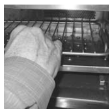
Étape 2 (figure B)

⚠ ATTENTION : Ne pas enlever la plaque de distribution d'air en verre supérieure; toute réparation résultant d'un bris de verre ne sera pas couverte par la garantie.